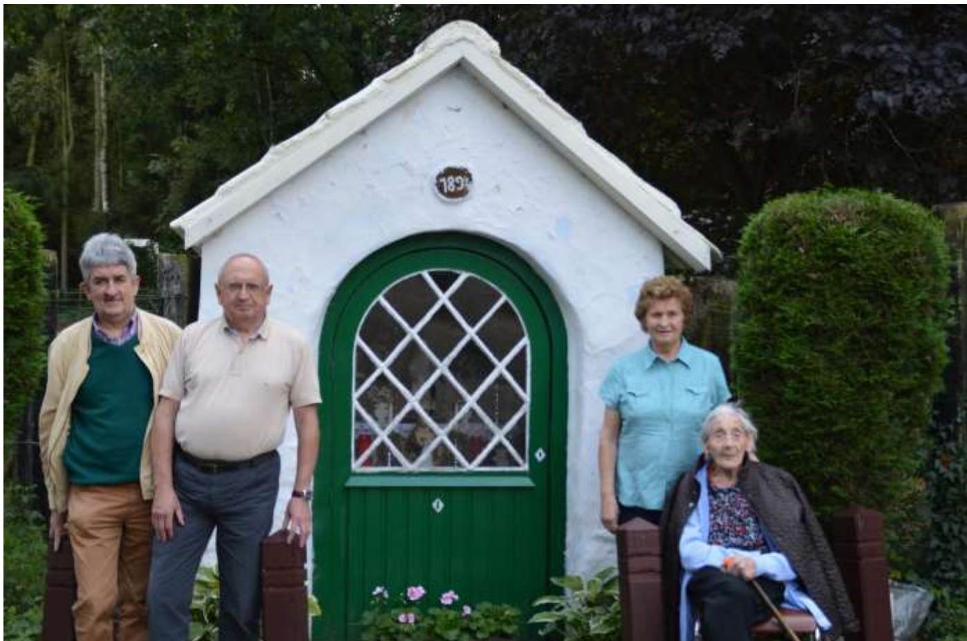
Deze foto dateert van 10 jaar geleden