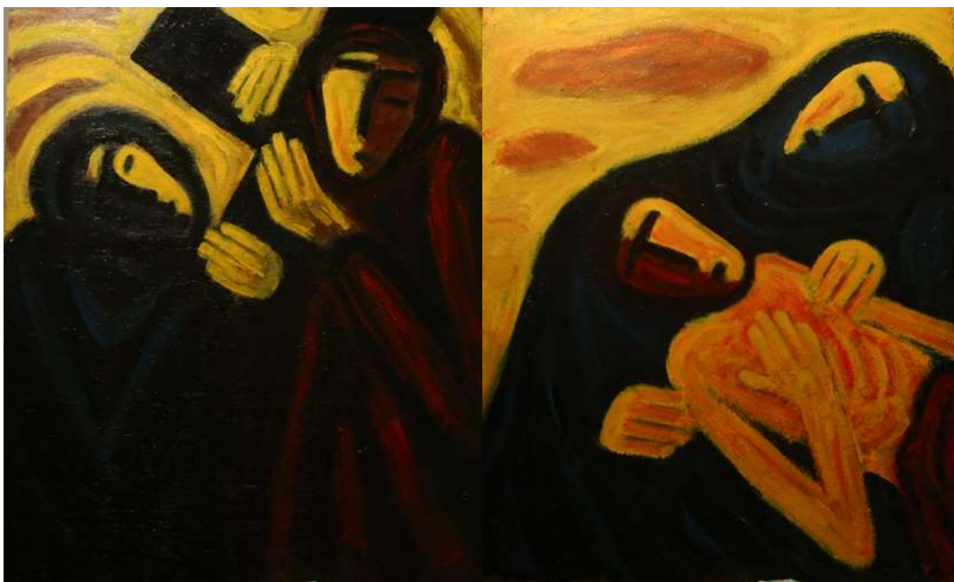
Jezus ontmoet Zijn moeder